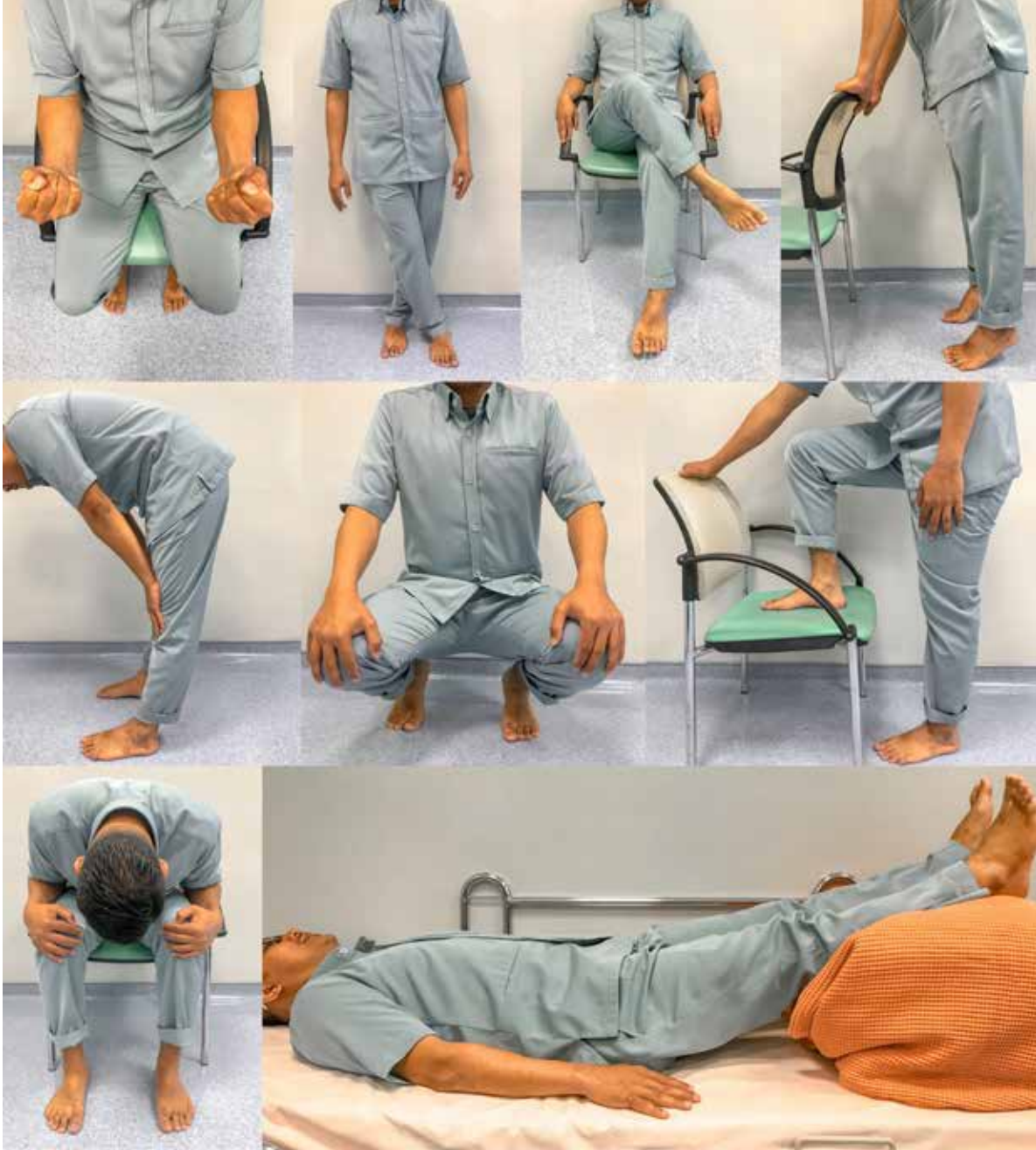
Figure: Physical counter-measures that you can perform when you are experiencing symptoms of orthostatic hypotension. A. Fist clenching; B. Leg crossing; C. Sit down with leg crossing; D. Toes raise; E. Lean forward; F. Squat; G. Place a foot on one stool or chair; H. Sit in a knee-chest position (crash position); I. Lie down with legs raised.

Note: These physical manoeuvres should be tailored according to the patient's ability, with extra caution in those who are at risk of falls.